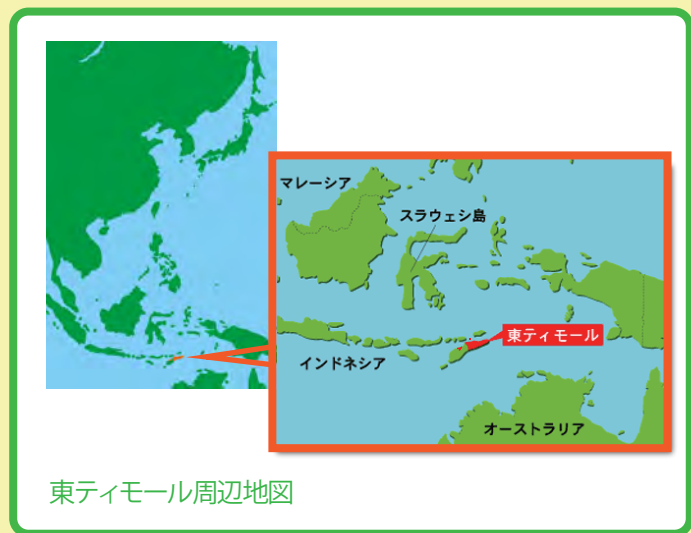
東ティモール周辺地図