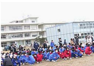
▲津波のときは校舎 3 階へ