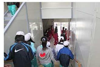
▲仮設校舎からの避難