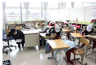
▲地震発生 机の下へ

訓練では、担任の先生の指示に従って校庭南側に避難し、避難経路や避難の仕方を確認しました。