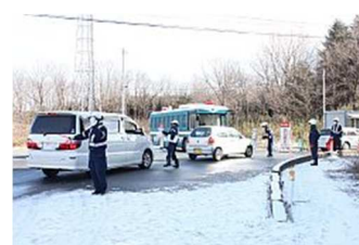
▲日陰には雪が残る馬事公苑▲車両などの確認を終え警戒区域