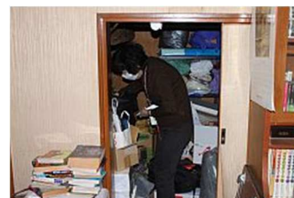
▲限られた時間での作業(原町区)▲片付けする住民(小高区)