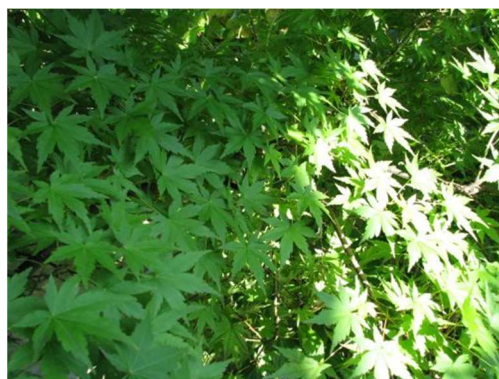
震災前のわが家の庭で

http://blog.goo.ne.jp/minamisoumashi-hinan/e/575f4a6116c8a86f59d1de5d79e5499f