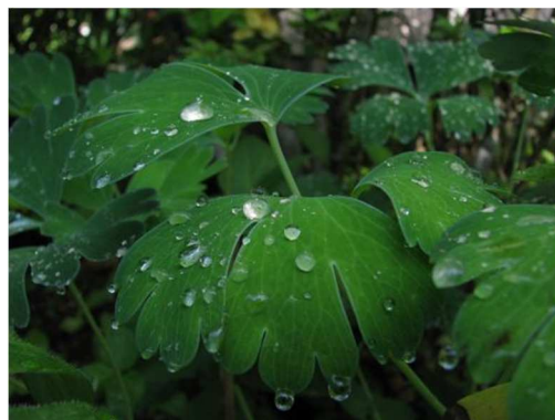
震災前のわが家の庭で

http://blog.goo.ne.jp/minamisoumashi-hinan/e/6a6b3eae0e0e63392a42563aa21a1694