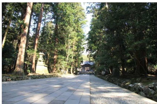
弥彦神社を訪ねて

http://blog.goo.ne.jp/minamisoumashi-hinan/e/9e2e14362ef4931a791adf2b210a3a4f