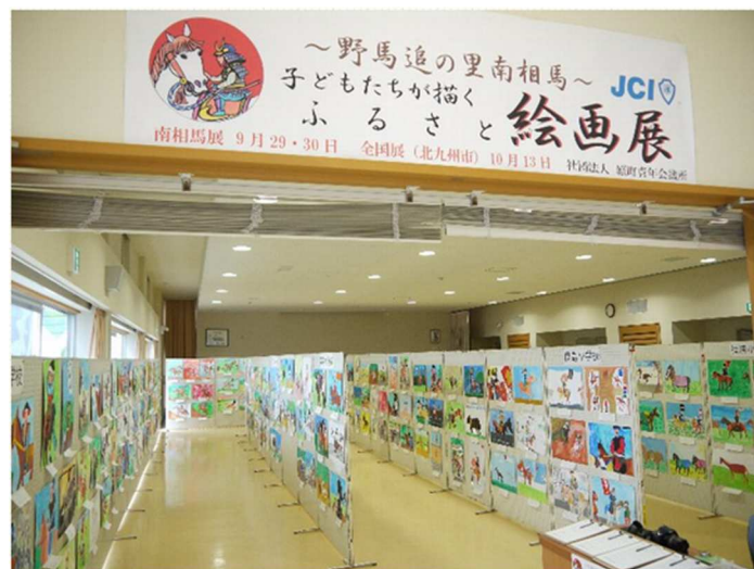
石神第一小学校、原町第三小学校