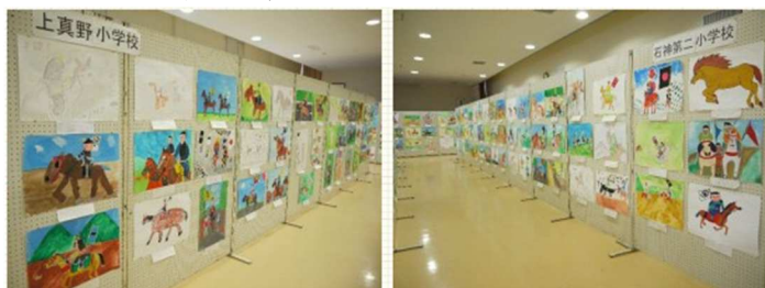
上真野小学校、石神第二小学校

10/13(土)には、北九州市小倉城 勝山公園での全国展にこの、～野馬追の里 南相馬～子どもたちが描く ふるさと絵画が展示されることになっています。