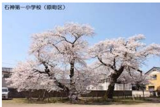
石神第一小学校(原町区)

各避難所をはじめ、全国各地へ避難されている方が少しでも和んだり癒されたりしていただければと思い「桜だより」をお届けします。