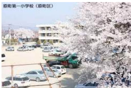
原町第一小学校(原町区)