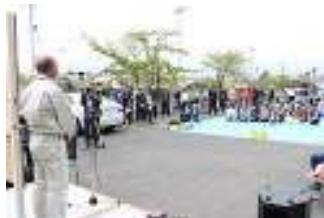
▲開会式で市長が激励

会場では、炊き出しボランティアから贈られた食材を自ら調理し、焼き肉や焼き鳥、雑煮などが食べ放題。足湯や歌謡ショー、極真空手などが披露され、参加した皆さんは連休の1日を楽しみました。