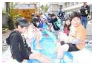
▲西山温泉のお湯で 足湯を楽しむ子どもたち