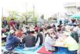
▲テーブルを囲んで親睦を深める