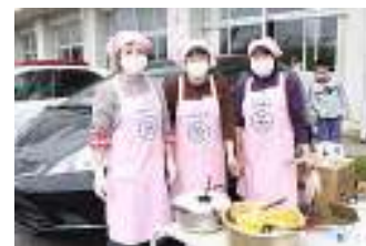
▲食生活改善推進員もお手伝い