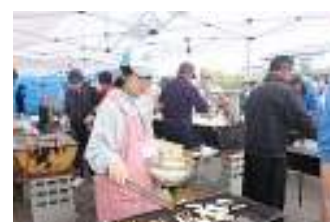
▲ボランティアも一緒に