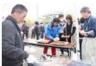
▲炭火でおいしく焼き上げます