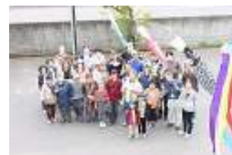
▲こいのぼりと一緒に