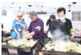
▲不足がちな野菜を鉄板焼で