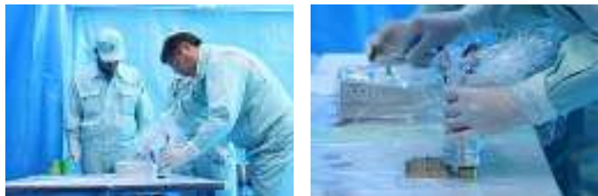
▲ブルーシートに覆われた測定室▲慎重に放射線量を測定

で4月下旬から5月上旬の気温となりましたが、夏服に身を包んだ高校生の通学する姿が見られました。