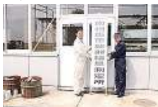
▲入口に設置した看板

測定は市が「ゆめサポート南相馬」に委託し、簡易測定をした値が10000cpm以下なら正式な計測を行います。