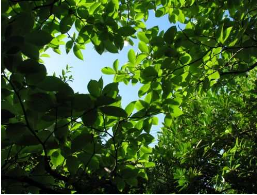
昨年 7 月 わが家の庭から見上げる空は 透き通ってきれいでした。

http://blog.goo.ne.jp/minamisoumashi-hinan/e/838184eec7ebdd5a4bc9b80fad20f698